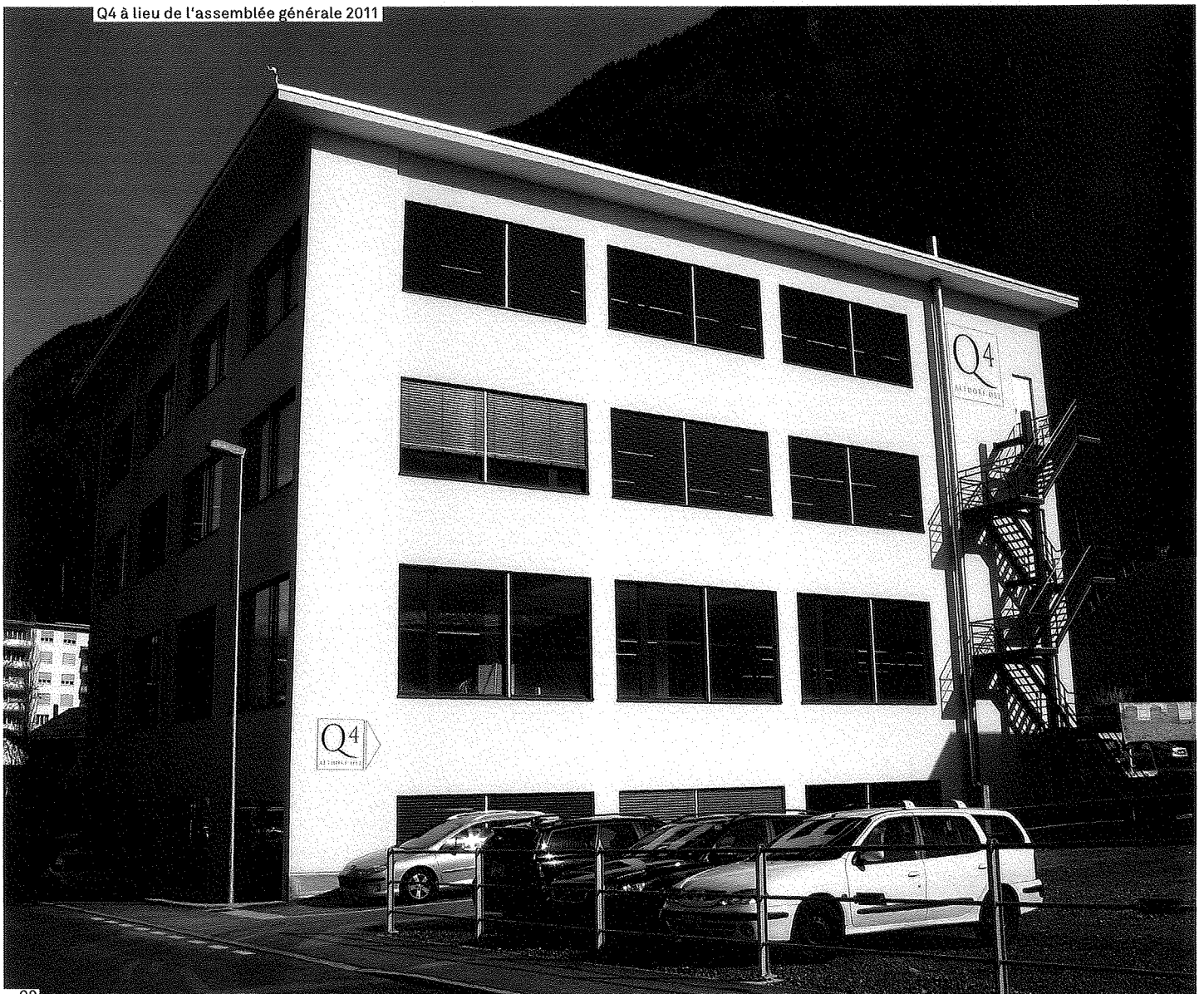
Q4 à lieu de l'assemblée générale 2011