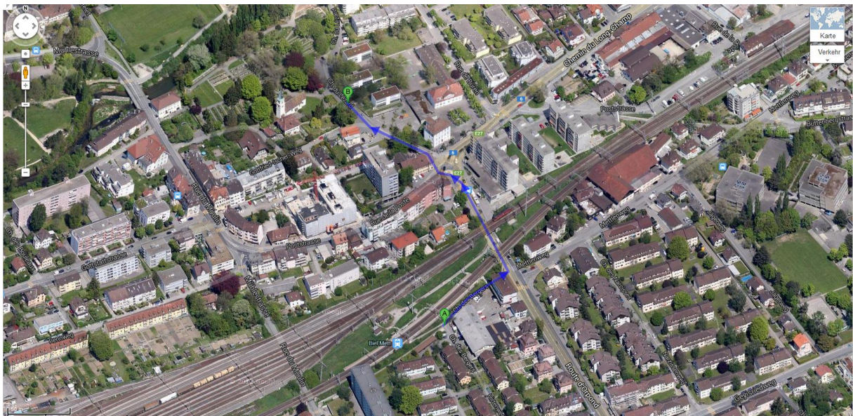
A: Bahnhof / Gare Biel Mett

Le voyage en voiture n'est pas recommandé. De l'église de Bienne-Mâche, nous allons marcher ensemble à travers de la ville de Bienne jusqu'à la plage.