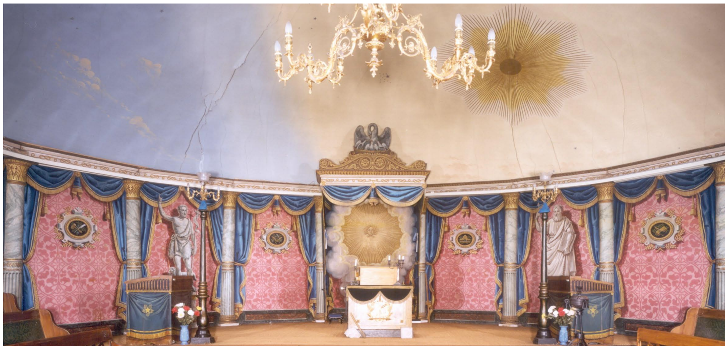
La Chaux-de-Fonds NE • Loge maçonnique de l'Amitié