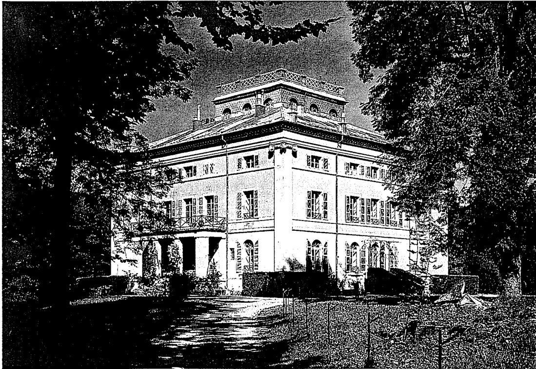
La villa néo-palladienne