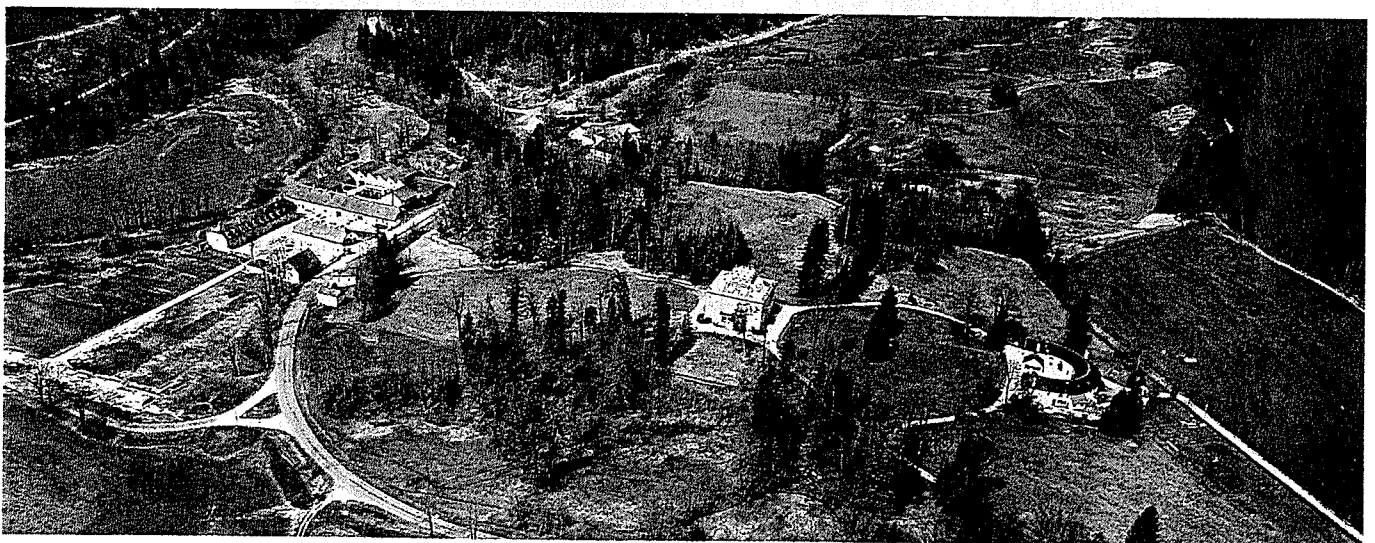
Vue aérienne du site