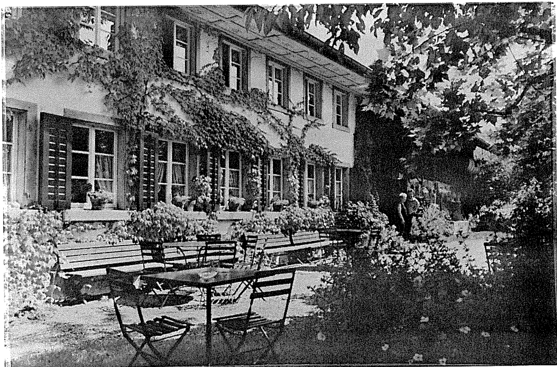
Restaurant Obstgarten in Oberlangenhard (Tösstal ZH)