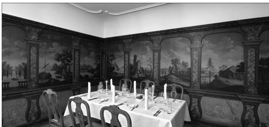
«Spezialpreis der Mobiliar 2011» / «Prix spécial de la Mobilière 2011» • «Restaurant Schloss Wülflingen», Winterthur