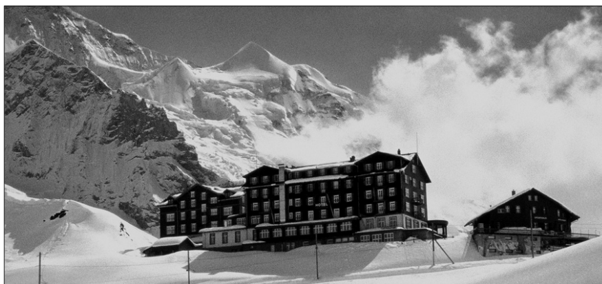
Preis / Prix «Historisches Hotel des Jahres 2011» • «Hotel Bellevue des Alpes», Kleine Scheidegg, BE

Bereits zum fünfzehnten Mal seit 1997 hat die Jury «das historische Hotel des Jahres» erkoren. Aus den eingereichten Bewerbungsdossiers wurde das «Hotel Bellevue des Alpes» auf der Kleinen Scheidegg zum Sieger ernannt und trägt fortan das geschützte Prädikat «Historisches Hotel des Jahres 2011». Das «Restaurant Harmonie» in der Stadt Bern, erhielt von der Jury eine «Besondere Auszeichnung». Den von der Mobiliar gestifteten «Spezialpreis der Mobiliar 2011» für ein historisches Einrichtungsstück ging an das «Restaurant Schloss Wülflingen» in Winterthur, für die vorbildliche Restaurierung und das Erlebbarmachen der wertvollen Innenausstattung.