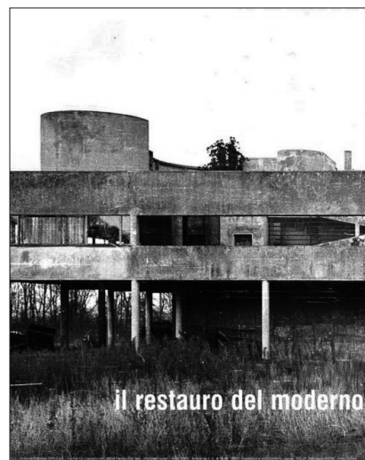
Zeitschrift «PARAMETRO», Ausgabe 266

Am 10. und 11. Juni 2010 fand an der Accademia di architettura, Mendrisio die Starttagung des Projektes zur Erstellung einer «Enciclopedia critica per il restauro e riuso dell'architettura del XX secolo» statt.