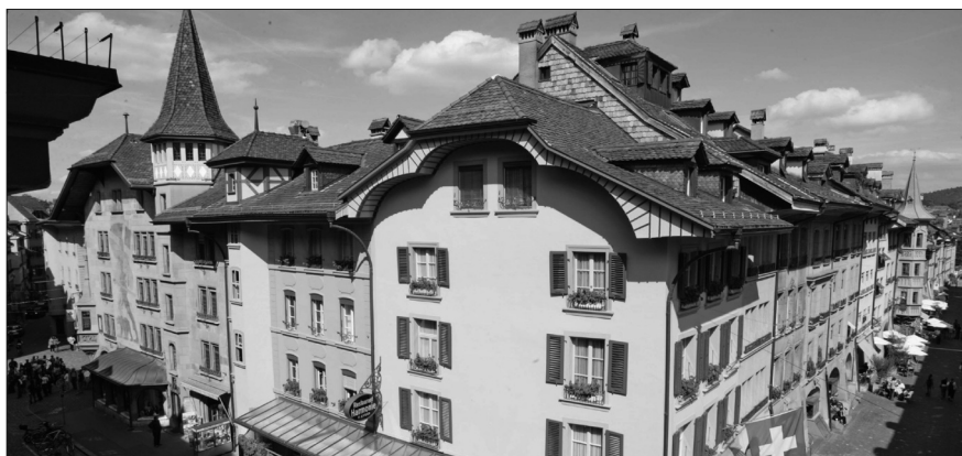
«Besondere Auszeichnung 2011» / «Mention spéciale 2011» • «Restaurant Harmonie», Bern / Berne