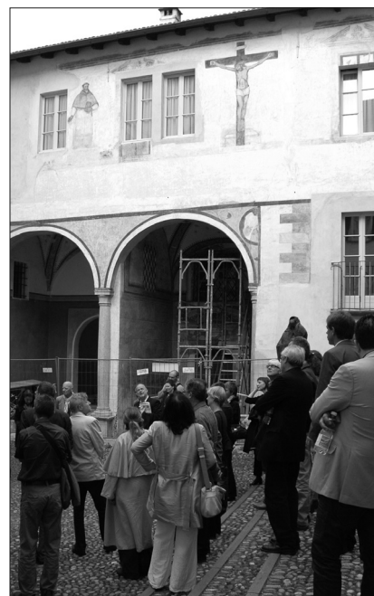
MV2010 Samstag / AG2010 Samedi 29.05.2010 Führung / Visite : Orselina, Santa Maria del Sasso