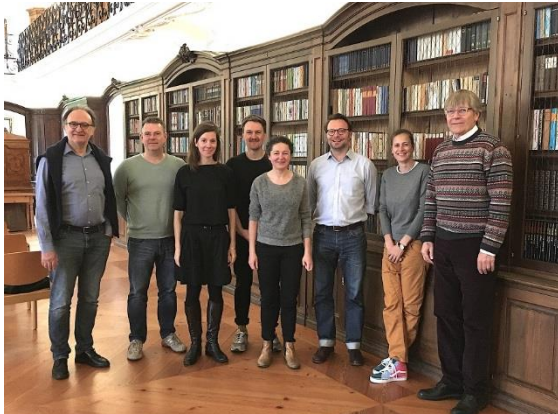
Mitglieder der Arbeitsgruppe „System & Serie“ an der Retraite im Kloster Fischingen