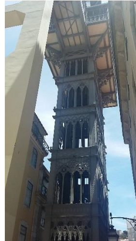
Aufzug in Lissabon

Das Thema der anschliessenden Tagung, die von der Universität Lissabon durchgeführt wurde "Contemporary interventions on cultural heritage: theory and practice" war gleichzeitig auch das Thema der beiden Exkursionen am Sonntag, einmal in Lissabon und einmal in Porto.