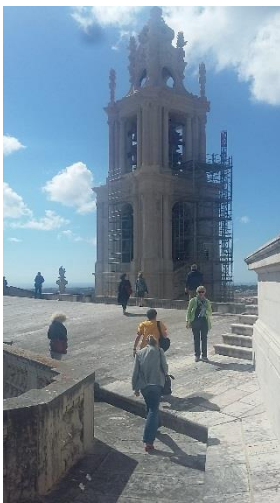
Dachlandschaft von Mafra, Portugal

Vorausgegangen war ein langes Ringen um die Frage, ob ein Gebäude nach einem Attentat zu einer Gedenkstätte oder zum Mahnmal wird und ob es in derselben Funktion erhalten bleiben kann.