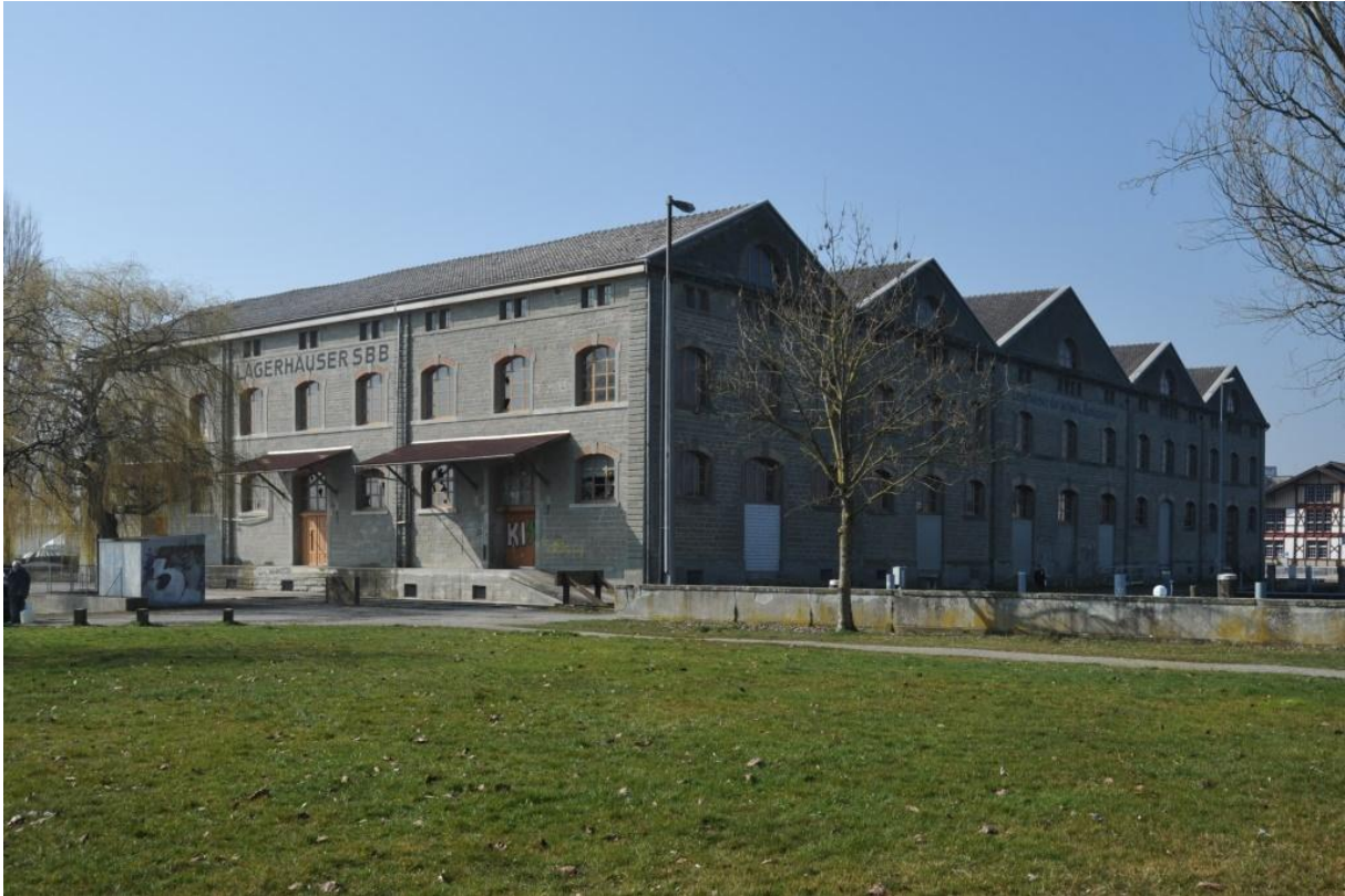
Entrepôt des CFF à Romanshorn, jadis le port intérieur le plus important en Europe.