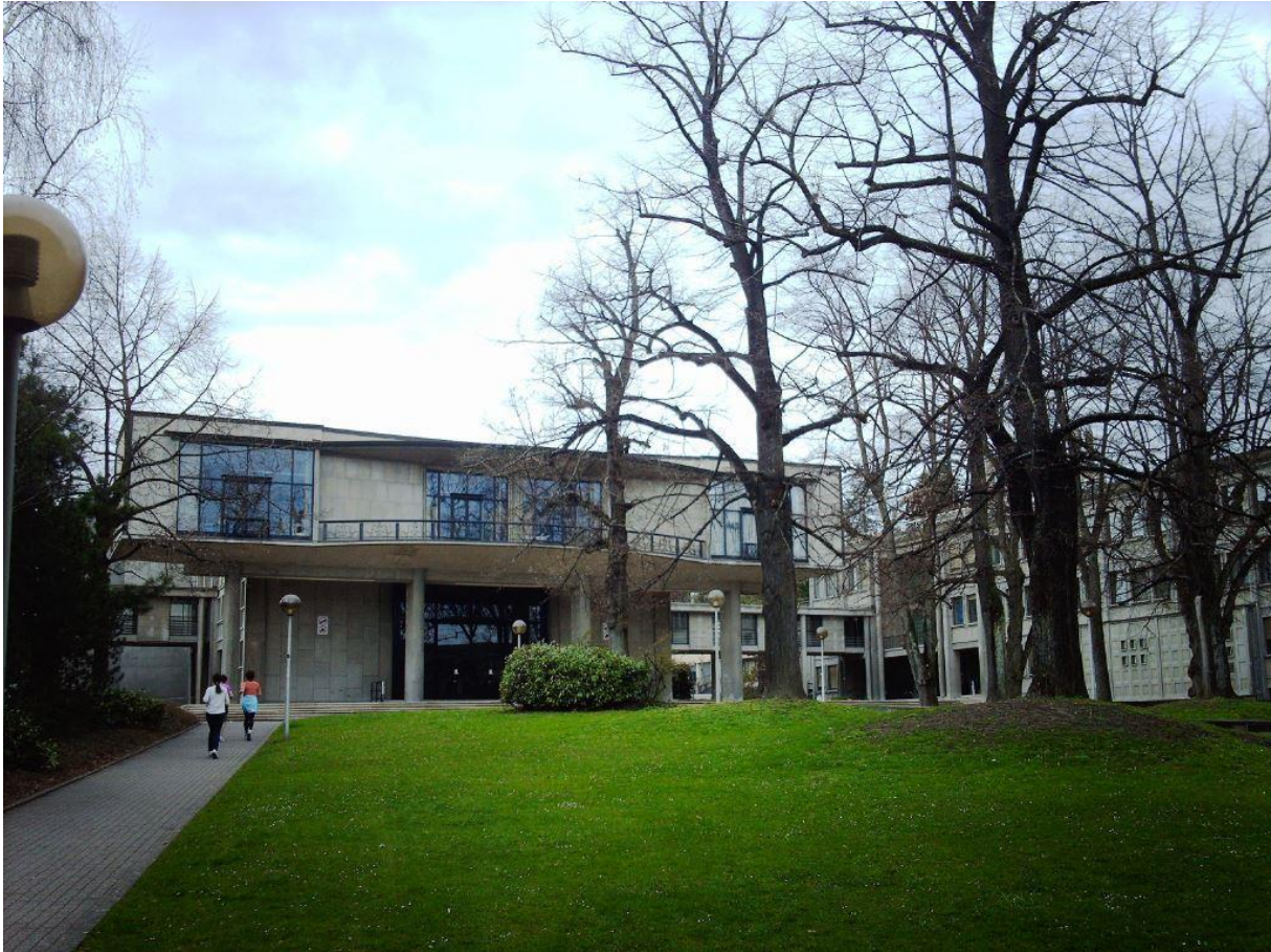
L' Université de Fribourg.

Le personnel du secrétariat d'ICOMOS Suisse remercie tous les participants de l'assemblée générale de cette année à Fribourg. Nous remercions particulièrement le couvent des Cordeliers pour leur hospitalité pendant l'assemblée, le colloque et l'apéritif. Nos remerciements englobent l'oratrice et les orateurs du colloque. Leurs interventions ont porté de l'importance scientifique à cette assemblée générale. Nous remercions également le service des biens culturels du Canton de Fribourg. Ceci nous a mis à disposition le vin d'honneur de l'Etat pour notre apéro. Un grand merci de notre part est dû aux guides des visites, qui ont parcouru la ville avec de nombreux membres et quelques hôtes pour leur montrer les trésors de leur ville. C'était un grand plaisir d'être si bien accueilli.