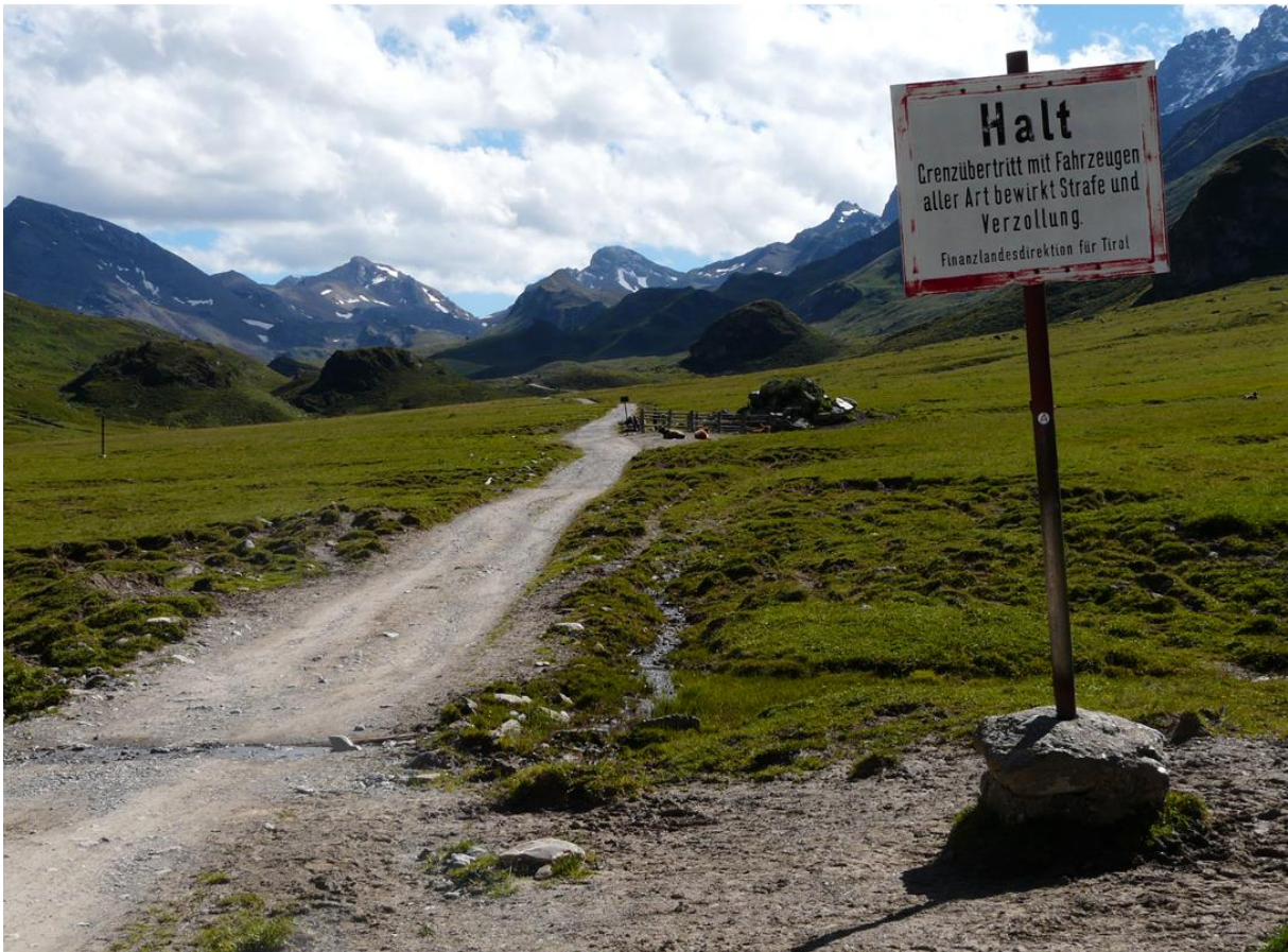
Grenzübergang Silvretta Schweiz/Österreich

1. Kolloquium im Rahmen des Europäischen Kulturerbejahres 2018 Samstag 26. Mai 2018 im Würth-Haus in Rorschach (SG)