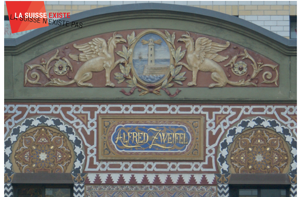
Lenzburg, Fassade der Malaga-Kellerei (Aufnahme: Francine Giese, 2016).