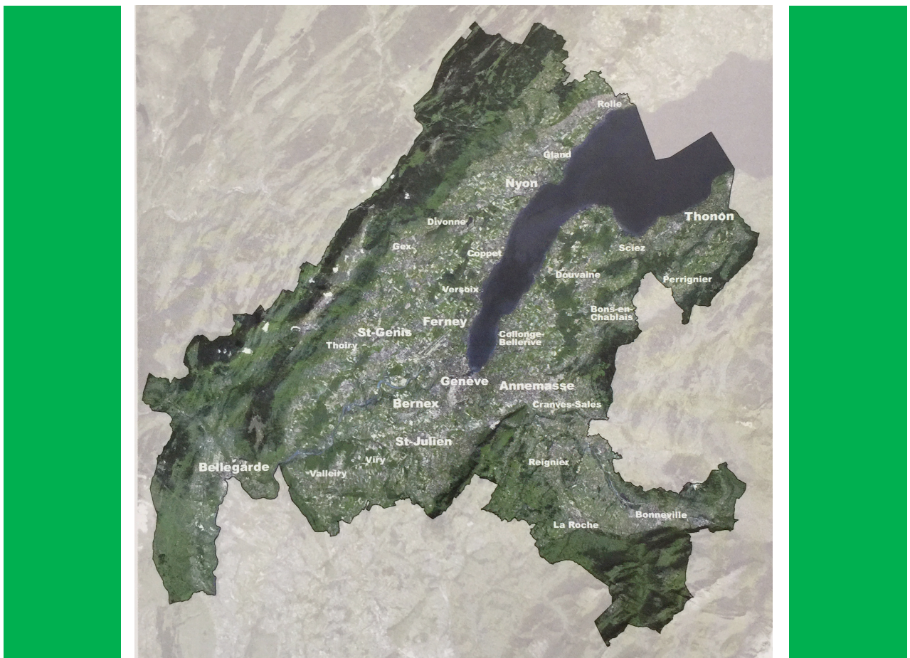
Le territoire transfrontalier

2 e colloque dans le cadre de l'Année européenne du patrimoine culturel 2018 samedi 13 octobre 2018 au «Théâtre Les Salons», rue Bartholoni, Genève