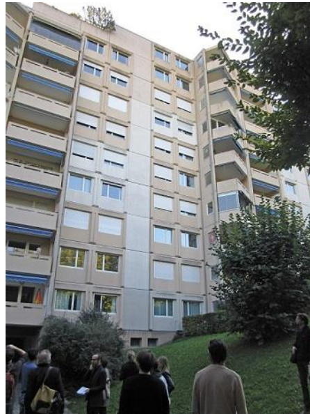
Visite des bâtiments du système avec des étudiants de la ZHAW Winterthur dans HS 2018.