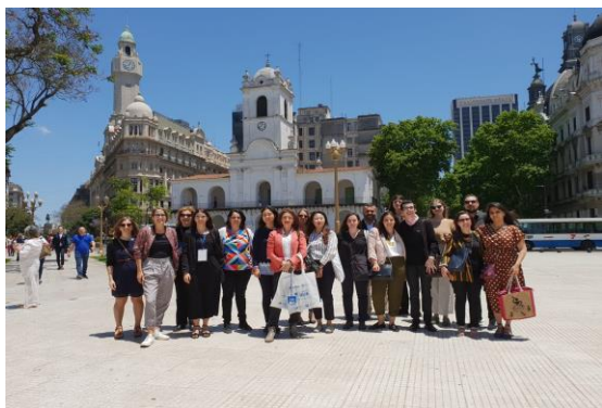
EP Gruppenfoto Buenos Aires

En 2018, le groupe restreint des professionnels émergents s'est renforcé en raison de l'arrivée de quatre nouveaux membres. L'objectif d'ICOMOS Suisse est de continuer à recruter d'autres membres, dans le but de favoriser les échanges entre les diverses générations intervenant dans le domaine du patrimoine bâti. Au cas où vous connaissiez quelqu'un qui souhaite s'investir professionnellement dans le domaine couvert par l'ICOMOS, n'hésitez pas à lui transmettre un bulletin d'inscription avec votre signature de parrainage. Pour le moment, la cotisation annuelle des membres de moins de trente ans est maintenue à CHF 85.-, en lieu et place de la cotisation annuelle ordinaire de 170.-.