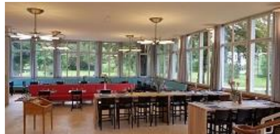
Club Haus Bata

Nous nous réjouissons de la participation nombreuse à cette Assemblée des membres.