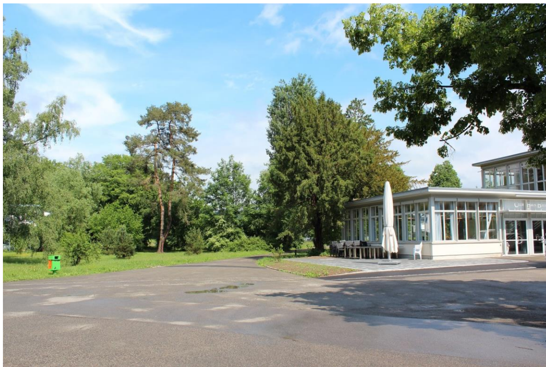
Club Haus Bata