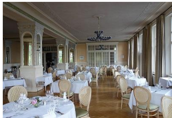
Après les premiers travaux de restauration, l'intérieur de l'hôtel historique de l'année 2019 se présente à nouveau dans les surfaces d'origine.