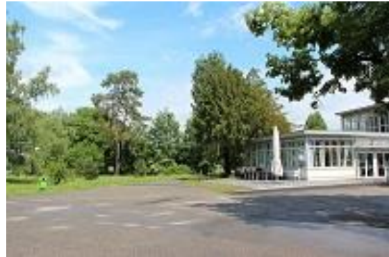
Club Haus Bata

L'assemblée des membres a lieu le 17./18. mai 2019 à Möhlin (Bata Club Haus, Bata Park 1, 4313 Möhlin).