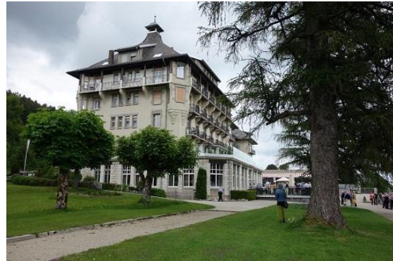
La Grand Hôtel des Rasses à Les Rasses/Sainte Croix est l'hôtel historique de l'année 2019