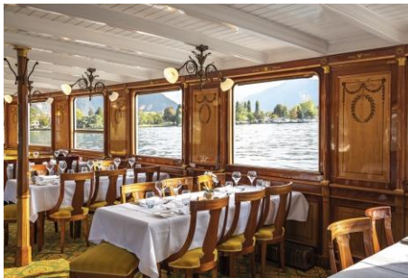
Restaurant historique de l'année 2019: flotte Belle Epoque CGN, Lac Léman. CGN bateau vapeur Italie 3

Ces distinctions visent à encourager les propriétaires d'hôtels et de restaurants historiques, les hôtelières et hôteliers, de même que les restauratrices et restaurateurs dans leur volonté de conserver le caractère historique de leurs établissements. Les prix décernés contribuent à sensibiliser le grand public aux efforts entrepris pour la conservation et l'entretien de ces hôtels et restaurants historiques.