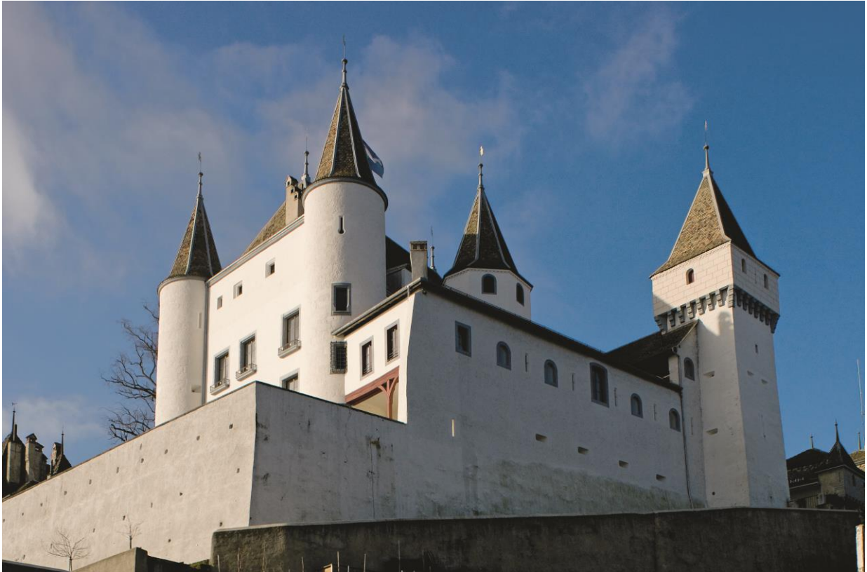
Ill. 1 Château de Nyon, 2007