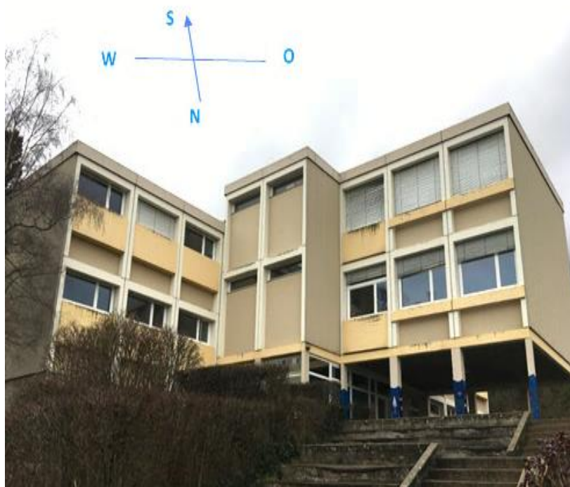
Ill. 16 Bâtiment scolaire Variel de Hauterive NE, façades sud et est