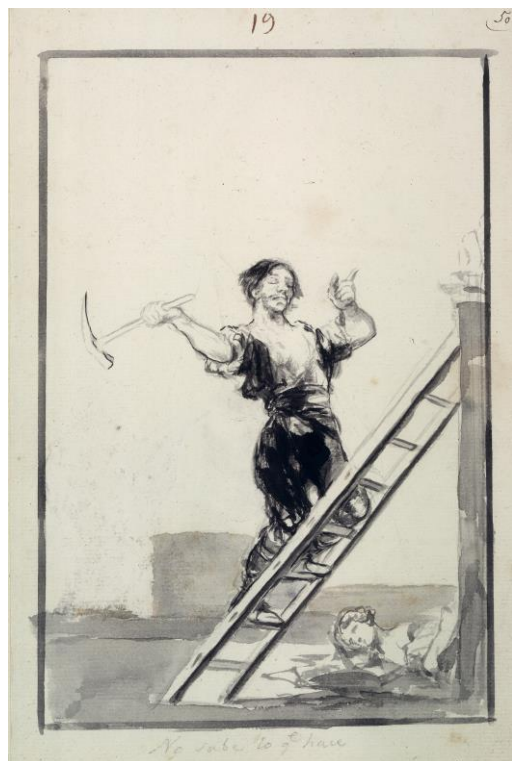
Ill. 17 «No sabe que lo hace» (Il ne sait pas ce qu'il fait...), Francisco de Goya, 1814 – 1817, encre de Chine

ICOMOS Suisse ne peut pas rester sans prendre position face à l'actuelle incohérence et indécence d'attitudes violentes contre toute expression culturelle au nom du « politiquement correct ». De quel droit peut-on effacer ou modifier – hélas souvent par ignorance – le passé, l'histoire et les connaissances de nos civilisations ?