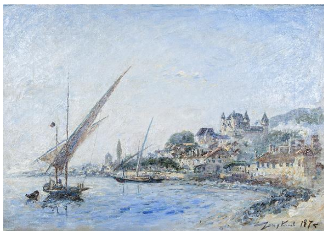
Ill. 4 Johan Barthold Jongkind, « Vue de Nyon depuis le Léman », 1875, huile sur toile, 33,6 x 46,8 cm.