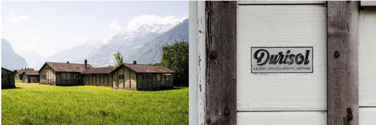
Ill. 13 Hôpital militaire à Altdorf UR, Durisol