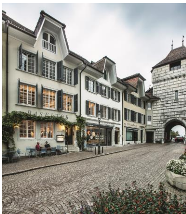
Ill. 11 prix spécial 2021: coopérative Baseltor, Solothurn, Baseltor Hotel-Restaurant