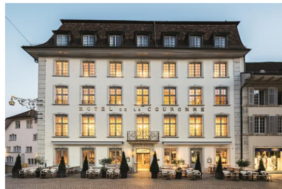
Ill. 10 prix spécial 2021: coopérative Baseltor, Solothurn, Couronne Boutique-Hotel