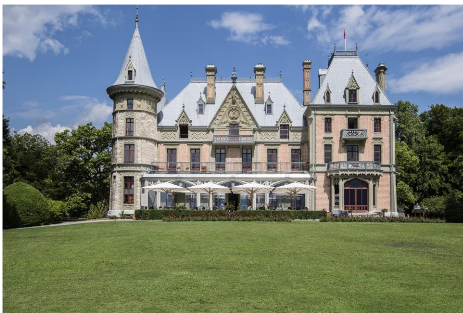
Ill 7 hôtel historique 2021: Château Schadau, Thouné