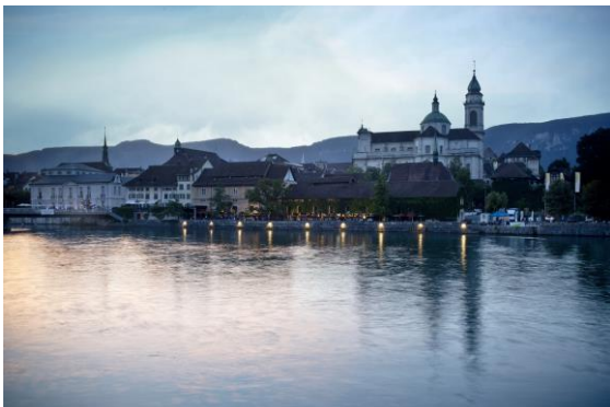
Ill. 9 prix spécial 2021: Solheure bar restaurant