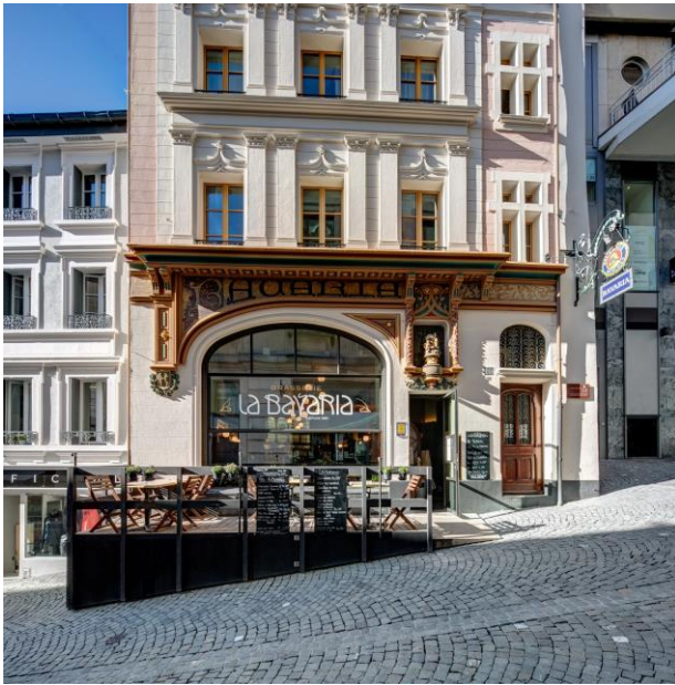
Ill. 8 restaurant historique 2021: La Bavaria, Lausanne

Le jury présente en 2020 la composition suivante :