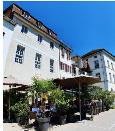
Ill. 12 prix spécial 2021: coopérative Baseltor, Solothurn, Salzhaus Restaurant