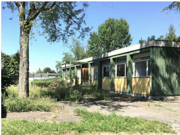
Ill. 14 L'ensemble Pavillonschule Bern Brünnen était composé de six bâtiments Variel du Programme 63 et du Programme Béton-Standard. © Bauart Architectes, Berne ICOMOS Suisse / Assemblée générale 2021

La sélection des bâtiments pour la publication du GT au cours du premier trimestre a été précédée d'une visite ciblée de certains bâtiments. J'ai continué les visites au printemps, également pour me faire une idée de l'état actuel des bâtiments et pour en savoir plus sur leur avenir. Il s'est avéré que certains des bâtiments en systèmes préfabriqués que nous avons sélectionnés pour le chapitre inventaire de la publication sont gravement menacés de démolition ou sont confrontés à de profondes modifications de leur structure. En raison de la situation de pandémie au printemps, qui a également touché les bibliothèques et les archives, les recherches supplémentaires n'ont pu être achevées qu'avec retard au cours de l'été.