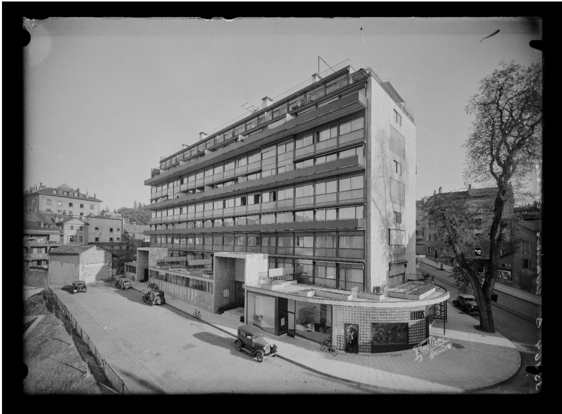
vue générale de la façade nord de l'immeuble Clarté, février 1934