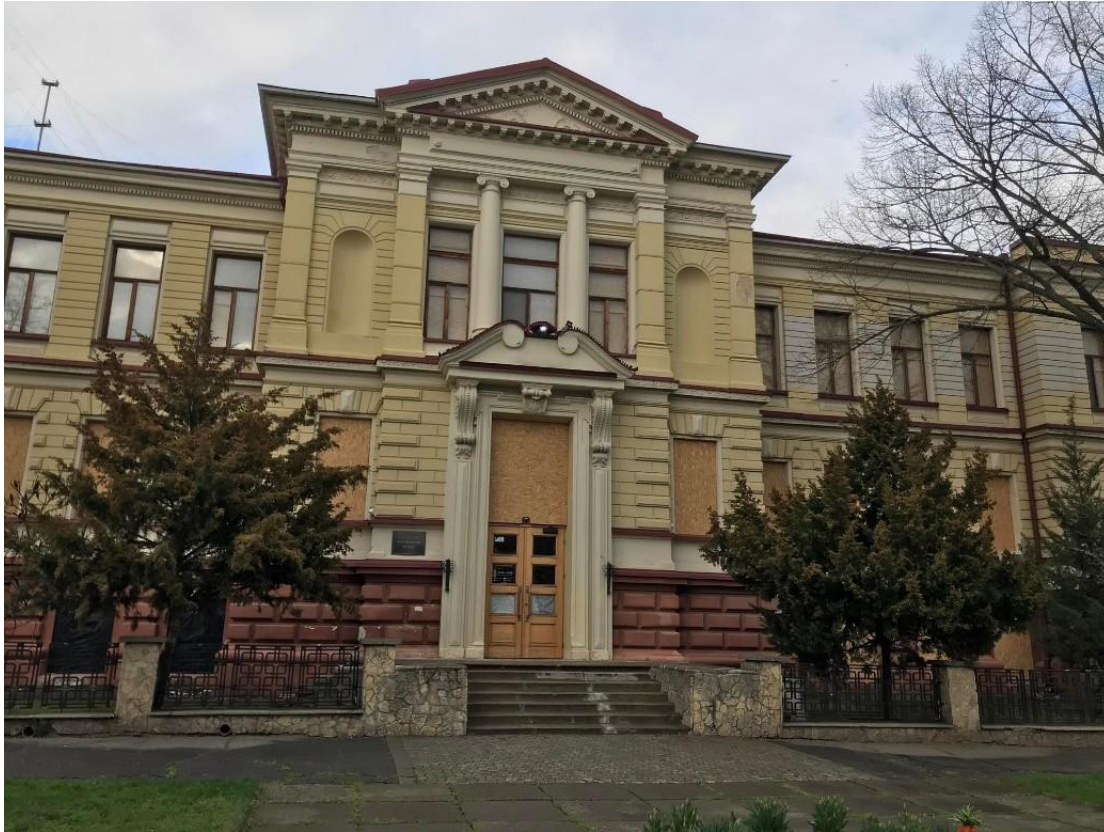
La photographie indique l'utilisation du matériel envoyé de Suisse en Ukraine