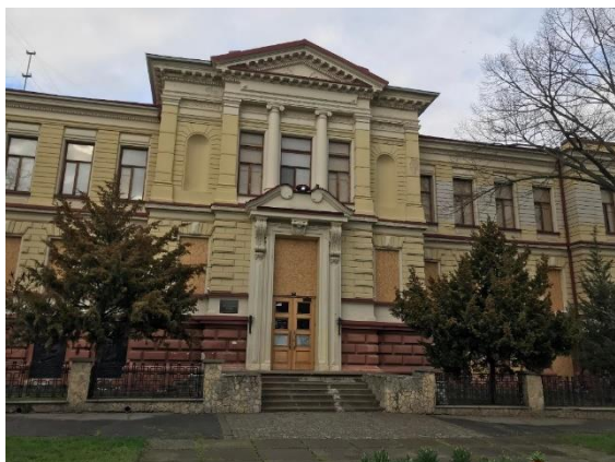
La photographie indique l'utilisation du matériel envoyé de Suisse en Ukraine