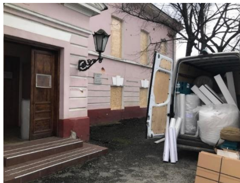
La photographie indique l'utilisation du matériel envoyé de Suisse en Ukraine

L'argent ainsi obtenu fut promptement réparti de la manière suivante : CHF 85'000 destinés à un transport de matériel prévu pour le 16 janvier 2023 depuis la Suisse, ainsi que CHF 15'000 consacrés au matériel informatique fourni à l'université de Lviv.